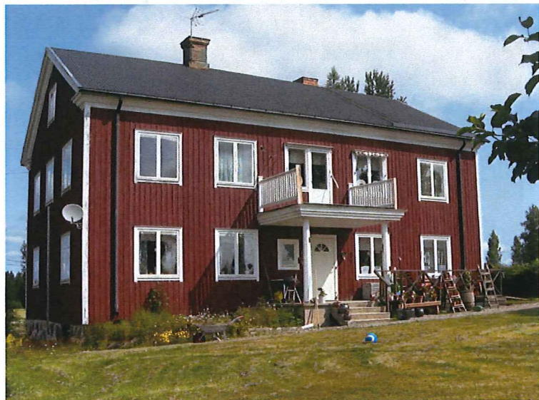
Bostadshuset vid Frejds i Tomtnäs.