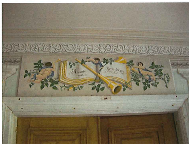
Detalj av det målade väggfältet ovanför en av pardörrarna.