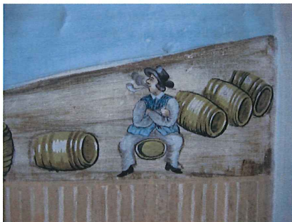
Detalj av en av de målade figurena på ett av väggfälten.