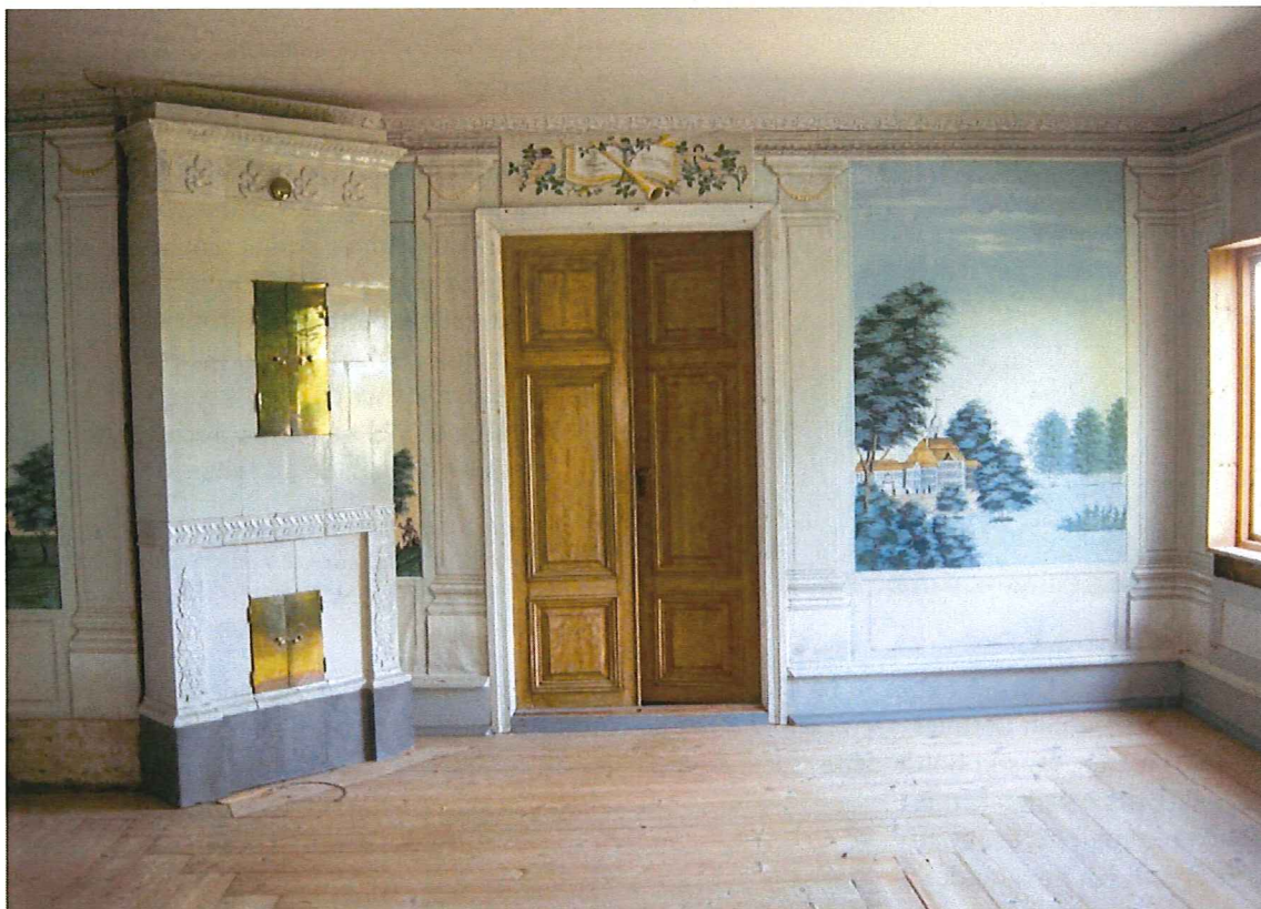
Salen efter avslutad renovering av väggfälten. Jämför med fotot på föregående sida taget från samma plats i rummet..

hörnlisterna samt vid anslutningen mot sockellist och dörrfoder. Då de nuvarande fönstren är lägre än de ursprungliga blev det en tom väggyta ovanför som nu kläddes med papp och målades in i bottenfärgen. För att få måleriet att gå ihop har retuscheringar utförts på ett antal ställen. Genomgående har animaliskt lim samt torra färgpigment nyttjats i samband med renoveringen.