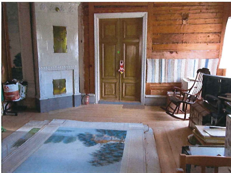
Salen vid Läns museets rådgivningsbesök på gården 2011. På golvet ligger de nedskurna väggmålningarna tillfälligt utbredda.

Gården besiktigades av Läns museet 1984 inför en då förestående renovering av övervåningen. När denna genomfördes 1985 skars väggmålningarna ned, men de 12 väggfälten numrerades upp och ritades in på en planritning. Väggmålningarna lades sedan upp på en plan skiva uppsatt under taket i ett angränsande rum. Renoveringen genomfördes i merparten av övervåningen, men slutfördes aldrig i salen och i det angränsande rummet där väggmålningarna hade lagts upp.